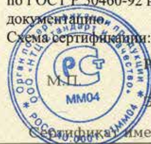
Схема сертификации: 3.

ДОПОЛНИТЕЛЬНАЯ ИНФОРМАЦИЯ Место нанесения знака соответствия: знак соответствия по ГОСТ Р 50460-92 наносится на ярлыки изделия и (или) в товаросопроводительную документацию