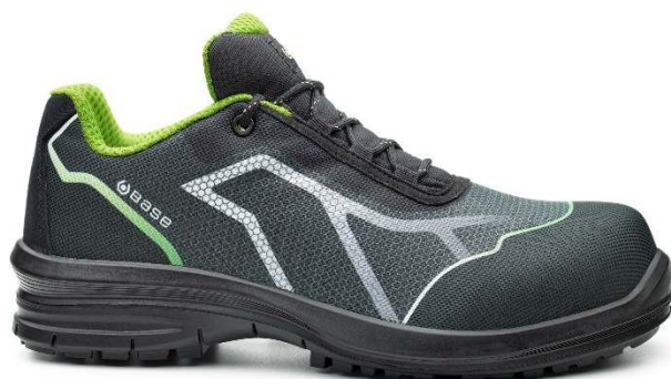
FOTO SUOLA PHOTO OF OUTSOLE